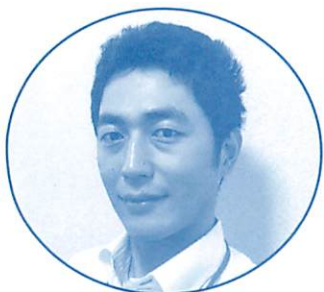
ファイナンシャルプランナー AFP(日本FP協会認定)