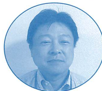
ファイナンシャルプランナー CFP(日本FP協会認定)